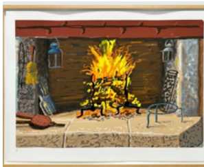
David Hockney, A Bigger Fire (from My Vormandy) , 2020 Est. $40,000–$60,000