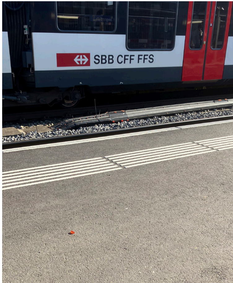
hb olten, gleis 7